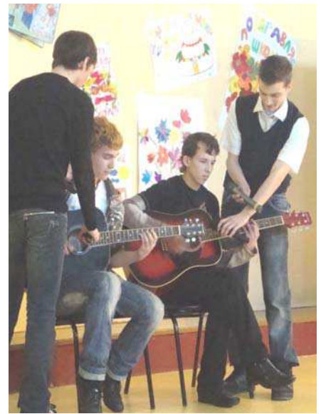
Авторские песни выпускников школы

Очень развеселил школьный бренд в виде пиццы. Согласитесь, большая часть учеников школы в основном покупает как раз те самые пиццы. После этого выступления стало интересно, сколько же пицц в день пекут в столовой? Наверное, штук 200, если мыслить по-детски. Еще много смешного и интересного было на концерте.