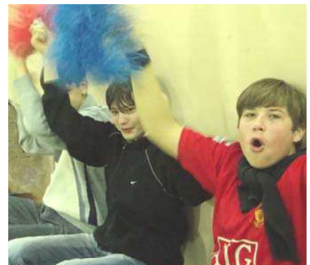
Болеельщики 8б класса

Можно смело подвести итоги – день рождения получилось очень ярким и зрелищным торжеством