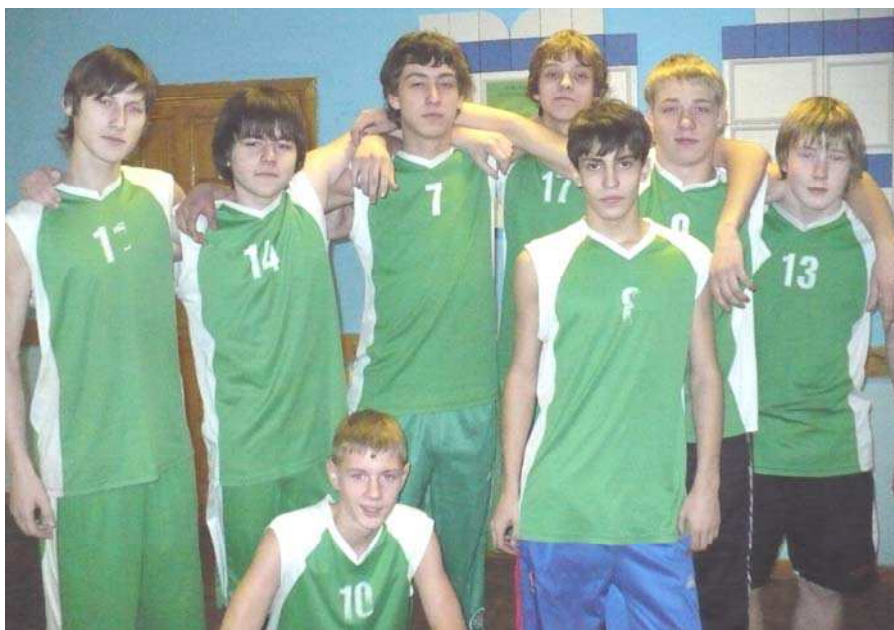
Сборная команда школы по баскетболу