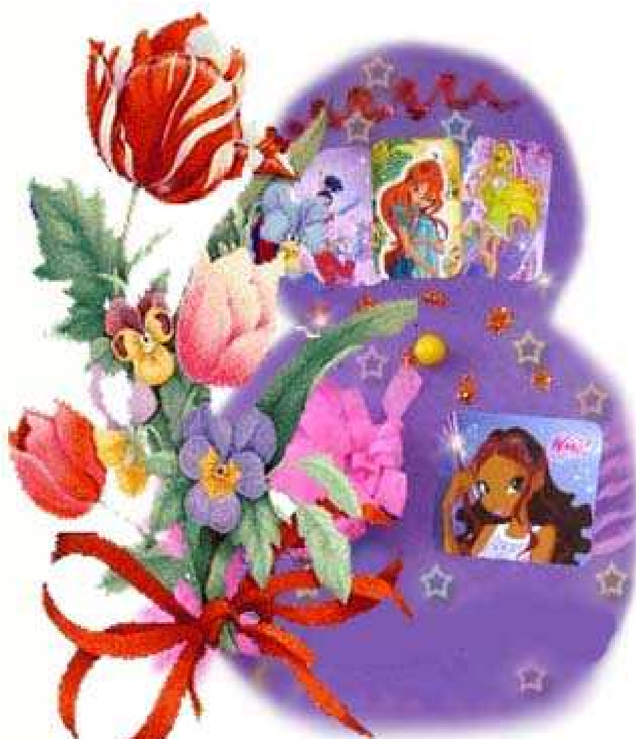
Апликация Ани Софроновой, 2а