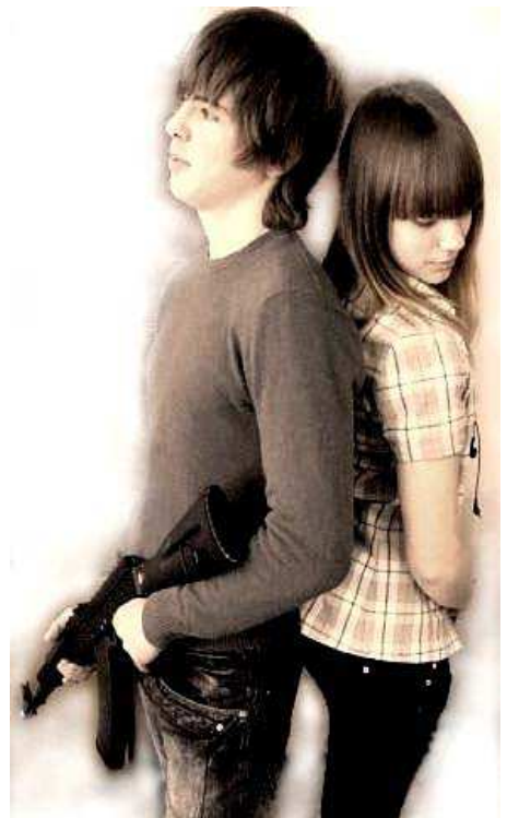
За их спиной, как за каменной стеной