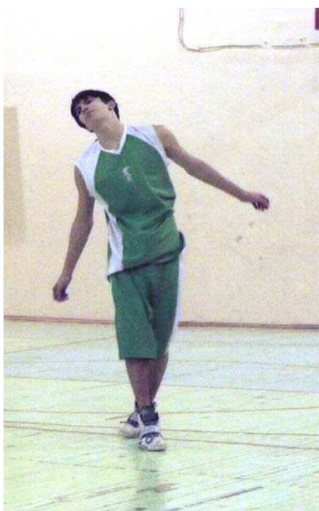
Главное настроиться на игру