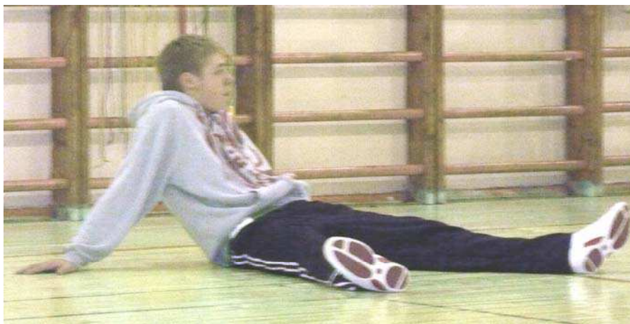
Хорошая разминка не помеха

гимнастикой, фигурным катанием, танцами, где все отретпировано и придумано, осталось только настроиться, отбросить все предрассудки и – вперед на сцену.