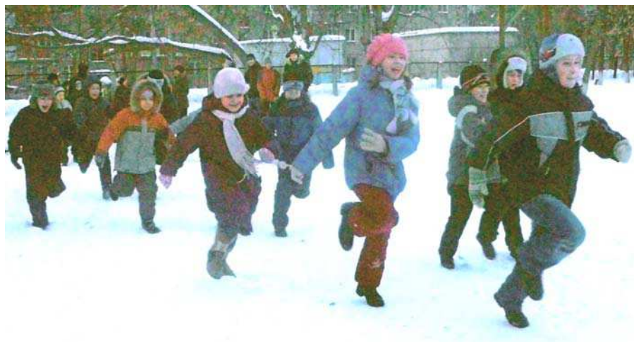
Вперед, на поиски сокровища!