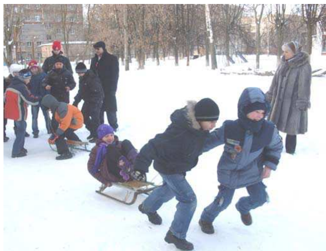
Катание на санях

В нашей школе прошли зимние игры, посвященные Масленице. Во вторник в соревнованиях участвовали все учащиеся начальной школы. Игры проводились на территории школьного двора. Катание на санках, футбол, игра в хоккей – состязания, в которых соревновались дети. Последнее задание состояло в том, чтобы дети по карте нашли загадочное сокровище. Все быстро справились с этим заданием. Мы были приятно удивлены, когда сокровищем оказались баран-