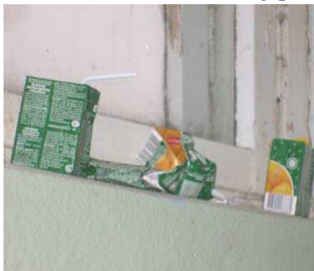
Сок, пирожок, подоконник, а дальше...